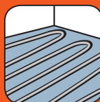
Compatible chauffage au sol