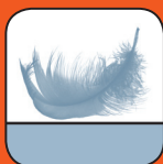
Plus de confort