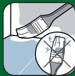
Ne peluche pas