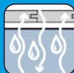
Wasser- und wasserdampfdurchlässig