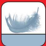
Plus de confort