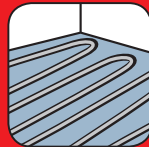
Compatible chauffage au sol