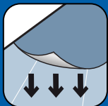
Haftend auf Untergrund