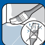
Ne peluche pas